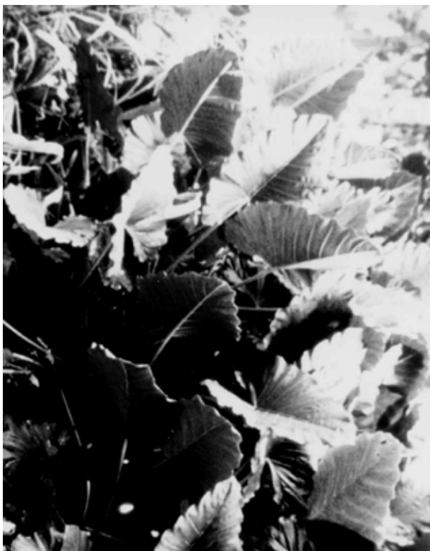
Fig. 1. La planta Alocasia macrorrhiza

Otros artrópodos de gran talla fueron encontrados en las axilas. Un arácnido perteneciente a la familia Ctenidae, también se sumerge en el agua al ser perturbado, fue encontrado en el 4,9 % de las axilas y se observó su capacidad para depredar mosquitos que emergen de las pupas en el laboratorio. Algo semejante ha sido observado por Beaver (1983) en Nepenthes albomarginata donde se ha identificado una araña del género Misumenops .